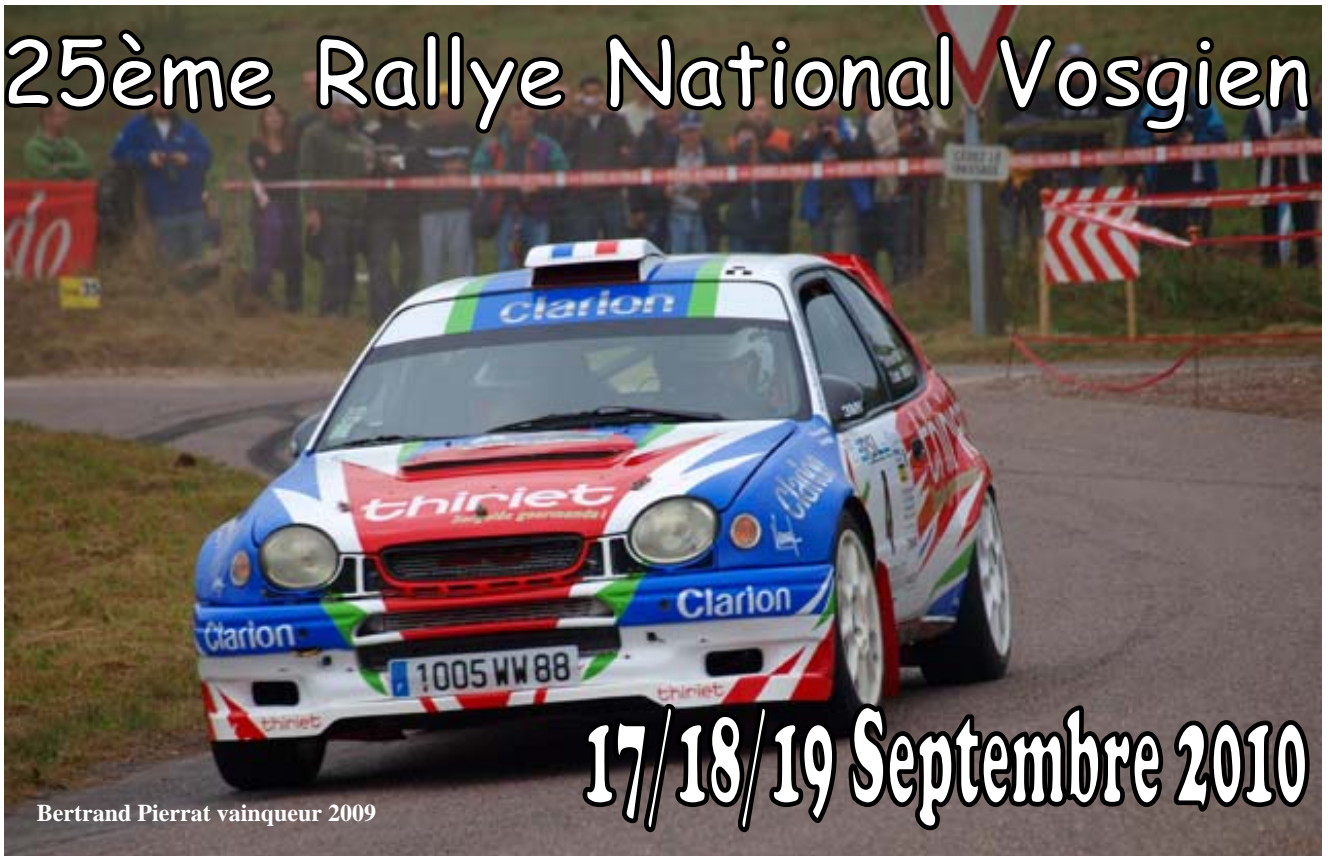
Bertrand Pierrat vainqueur 2009