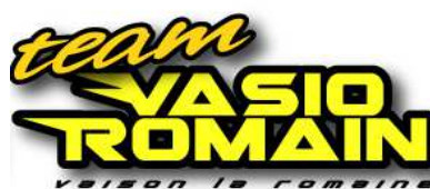
TEAM VASIO ROMAIN