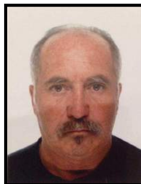
Marcel CERDAN Licence n°19463/0816