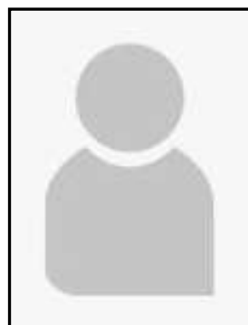
Elisabeth LABATUT Licence N° 216525